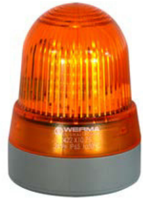
AL 251 – LED/Summer-Kombination Warnlampe orange