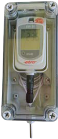
AL 250 Schutzbox für EBI 25 TE und TX