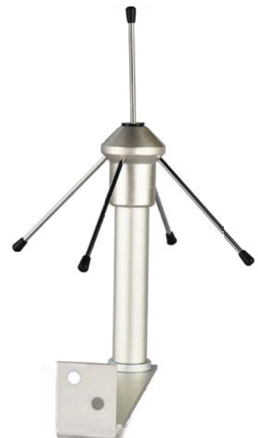
AL 116 Externe Antenne für das EBI IF 400 Interface zur Erhöhung der Sendestärke