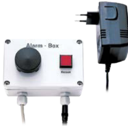
EBI 2 AB-2 – Alarmbox zum Anschluss an die Basisstation IF 400