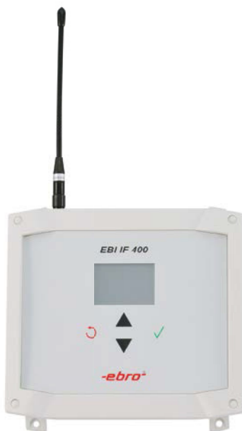
EBI IF 400 Interface inkl. Antenne