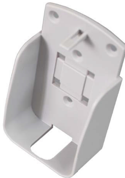
AG 152 Wandhalterung für EBI 25